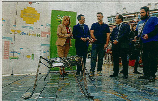
Un dron presidió la presentación de la Semana de la Ciencia.

■ El 95% del espectáculo será distinto a lo que se ha visto hasta ahora. Voy a basar mi actuación en la transparencia. En las cajas de madera pintadas todo se disimula un poco, yo me voy a basar en el cristal, que se vea todo. Hace unos cien años, un mago, P. T. Selbit, creó el número de la mujer serrada. Yo voy a hacer un homenaje a él, pero no cuento más, el resto se verá en el espectáculo (risas).