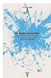
'EL PUÑO INVISIBLE'. Autor: Carlos Granés. Estilo: Ensayo. Editorial: Taurus. 489 páginas. Madrid, 2012. Precio: 22 euros.

en la que un escritor uruguayo muere en el café más señero de Madrid, y el lector no sabe bien si abundan los inocentes o si son los posibles culpables quienes mueven la narración. Alternando las voces y saltando con maestría por los pliegues del tiempo, la prosa de este autor se adapta como un guante a cada página, cada recuerdo y cada remordimiento. Un auténtico deleite con algunos pesos pesados del mundo literario asomándose en pequeños cameos. ■ A. PARRA SANZ