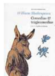
'COMEDIAS Y TRAGICOMEDIAS'. Autor: William Shakespeare. Estilo: Teatro. Editorial: Espasa. 1417 páginas. Madrid, 2012. Precio: 37,9 euros

Este libro sobre las vanguardias occidentales del siglo XX fue galardonado con el Premio Internacional de Ensayo Isabel Polanco. Sin embargo, pese a la seriedad de la materia, la naturaleza y las intenciones de las vanguardias (con frecuencia festivas, irreverentes y volubles), la soberanía con que el autor las aborda y la claridad con que las define y configura hacen que no sea una obra solo para especialistas. Una cumplida y amena panorámica que abarca del futurismo vociferante a los 'jóvenes indignados', de las artes plásticas a la música experimental, del dadaísmo al hippismo. ■ J. M. LÓPEZ DE ABIADA