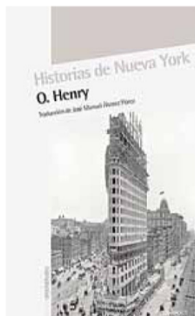
'HISTORIAS DE NUEVA YORK'. Autor: O. Henry Estilo: Narrativa Editorial: Nórdica Libros. Madrid, 2012. 173 páginas. Precio: 16,5 euros

autor se bebía una de sus dos botellas de whisky diarias, que finalmente le llevarían a acabar sus días con tan solo 47 años a causa de una cirrosis hepática. Su vida bien podría ser la de uno de los personajes de su obra, compuesta por cientos de historias como las pequeñas joyas que encontramos en este libro.