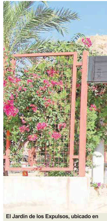
El Jardín de los Expulsos, ubicado en

ciones, los interesados pueden ponerse en contacto a través del teléfono 626 299 109, la web 'www.ayuntamientodeojos.es' y el correo, 'congresomoriscosojos@gmail.com'.