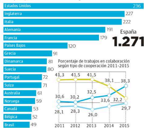
Porcentaje de trabajos en colaboración según tipo de cooperación 2011-2015