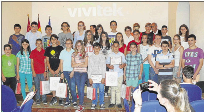
Ganadores de la primera fase de la Olimpiada Matemática Regional

de 969 alumnos de 106 centros educativos de la Región. Los veinte finalistas de ESO y los diez de 6º de Primaria también fueron obsequiados con un diploma. Esta edición de la Olimpiada Matemática Regional ha contado con la colaboración de la consejería de Educación, Cultura y Universidades, la Fundación Séneca, los ayuntamientos de Águilas, Mula y Yecla, la Universidad de Murcia, la Politécnica de Cartagena, el Centro de Profesores y Recursos de Murcia, los IES Europa de Águilas y José Martínez Ruiz 'Azorín' de Yecla y el CEIP Santo Domingo y San Miguel de Mula.