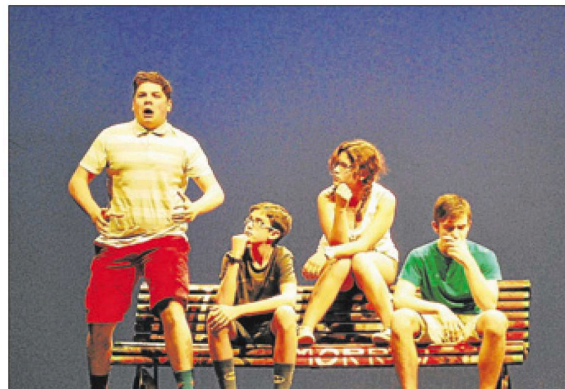
Un momento de la representación de la obra 'Game over' de Elenco 11

El concurso consta de dos fases, una autonómica, que es la que se acaba de celebrar, y otra nacional. A lo largo de todo el proceso los participantes aprenden a trabajar en equipo, conocer las artes escénicas y disfrutar de la convivencia con jóvenes de su misma edad con los que comparten gustos e inquietudes artísticas. Tanto el jurado nacional como el autonómico están compuestos por perso-