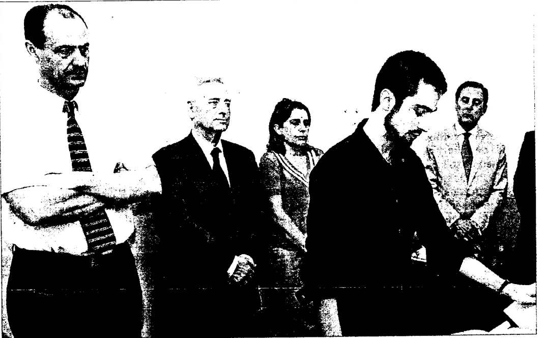
Vocales durante la toma de posesión celebrada el jueves.