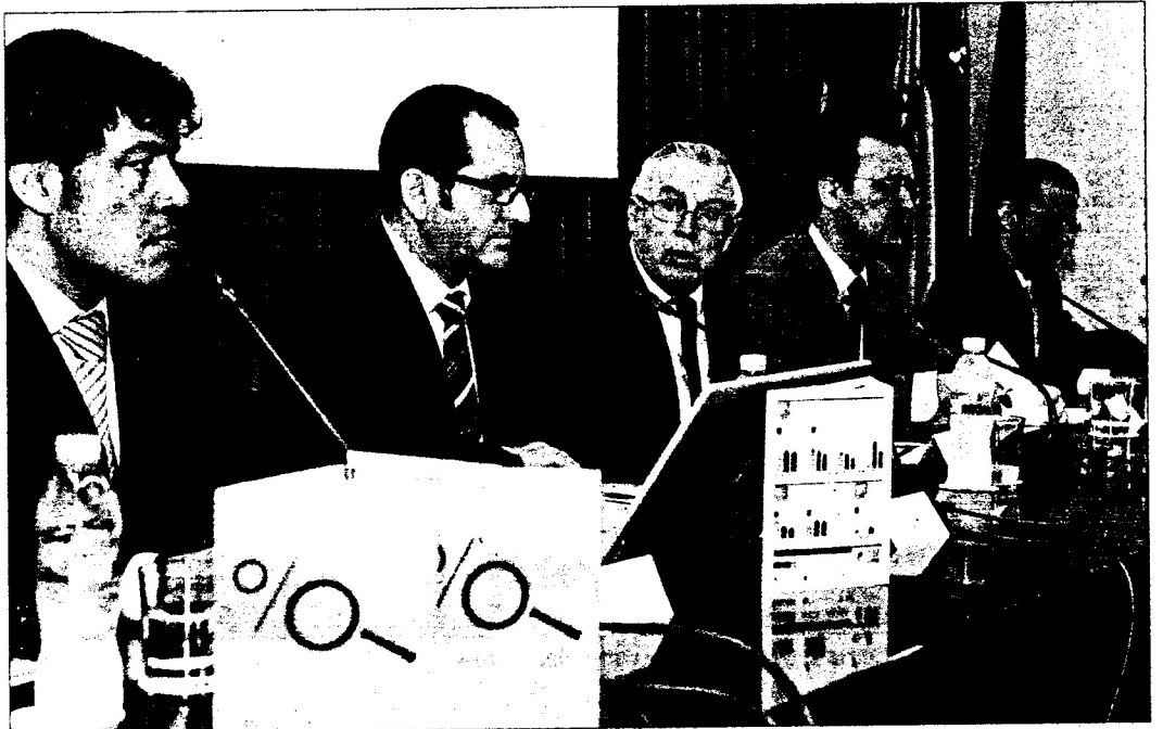
Miembros de la universidad encargados de presentar los datos de investigación.

El vicerrector de Investigación e Internacionalización de la UMU, hizo una detallada exposición de los datos destacando que «mantenemos la inversión» y «mantenemos nuestra capacidad intacta, al menos hasta el 2011». No obs-