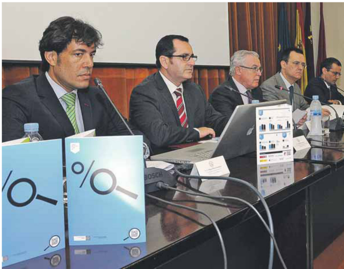
El vicerrector de Investigación y el rector de la UMU, en el centro de la imagen.

En el apartado de proyectos, el vicerrector de Investigación destacó «la elevada tasa de éxito», con un ascenso en la inversión en los programas regionales, que alcanzó los 13,2 millones de euros en 2011, repartidos en 209 proyectos, tres más que el año anterior. Sin embargo, en el ámbito nacional la cifra descendió en siete proyectos (290 en total). En cuanto a proyectos internacionales, el número ascendió a 44, dos más que en 2010.