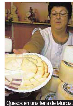
Quesos en una feria de Murcia.

dad de Murcia por Khalid Bou-toial, según fuentes de la institución docente. El estudio, que ha obtenido la calificación de sobresaliente 'cum laude', señala que en el queso al vino de Murcia «no se observan diferencias significativas para los parámetros fisicoquímicos y microbiológicos estudiados; sin embargo, los resultados del análisis sensorial determinan que el queso mejor valorado es el que se obtiene de la suplementación de la dieta con el tomillo».