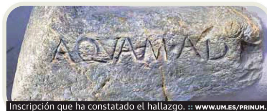
Inscripción que ha constatado el hallazgo. ■ WWW.UM.ES/PRINUM.

Investigadores de la Universidad de Murcia han confirmado que el sistema hídrico formado por un acueducto y las fuentes públicas más antiguo de la época romana, hasta la fecha atestiguado en la Península Ibérica, está en Cartagena. El equipo cien-