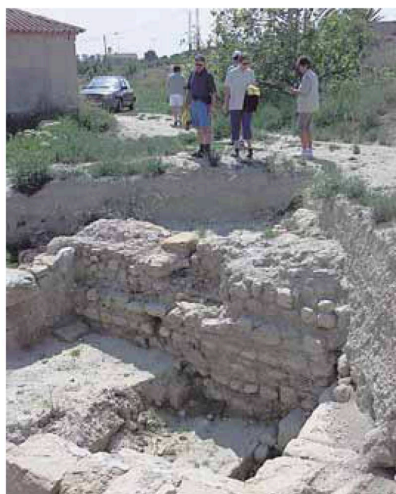
Excavaciones en el balneario romano de Fortuna.

Es especialmente relevante el caso del balneario de Fortuna porque acoge una de las piscinas termales más grandes de la época romana; algo que, según el profesor Matilla, «se debe a la gran cantidad de per-