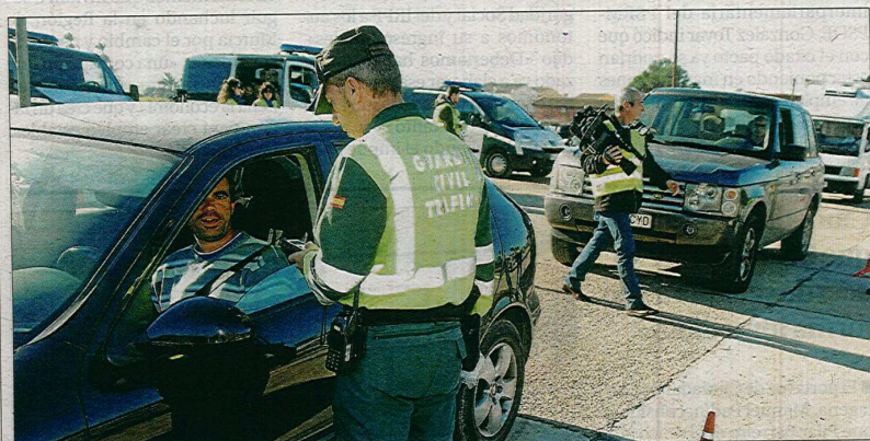
Controles de la Guardia Civil a conductores en una foto de archivo.