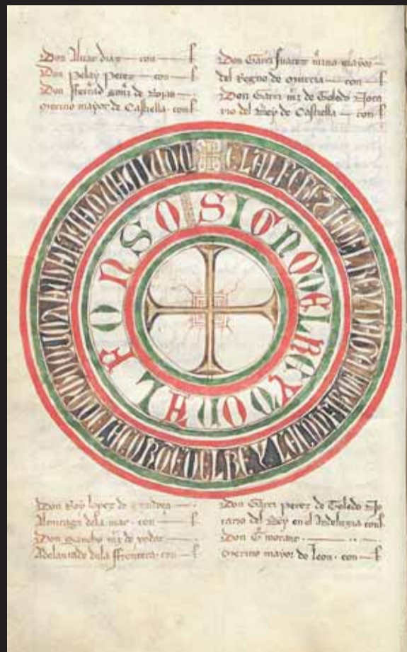
Rueda del Libro de Privilegios, del siglo XIV, propiedad del Archivo Municipal de Lorca

De cada documento se han generado dos versiones digitalizadas: una de excelente resolución, que se ha entregado a todos los archivos que han participado en el proceso. Es el mejor método para favorecer la consulta en los propios municipios, sin necesidad de manipular el original; otra, de baja resolución y con el distintivo del archivo propietario, es utilizada por la Fundación Integra para su publicación en Internet. En la dirección www.regmurcia.com/carmesi , y dentro del canal Historia del portal www.regmurcia.com , cualquier interesado puede encontrar todos los documentos digitalizados y consultar su contenido.