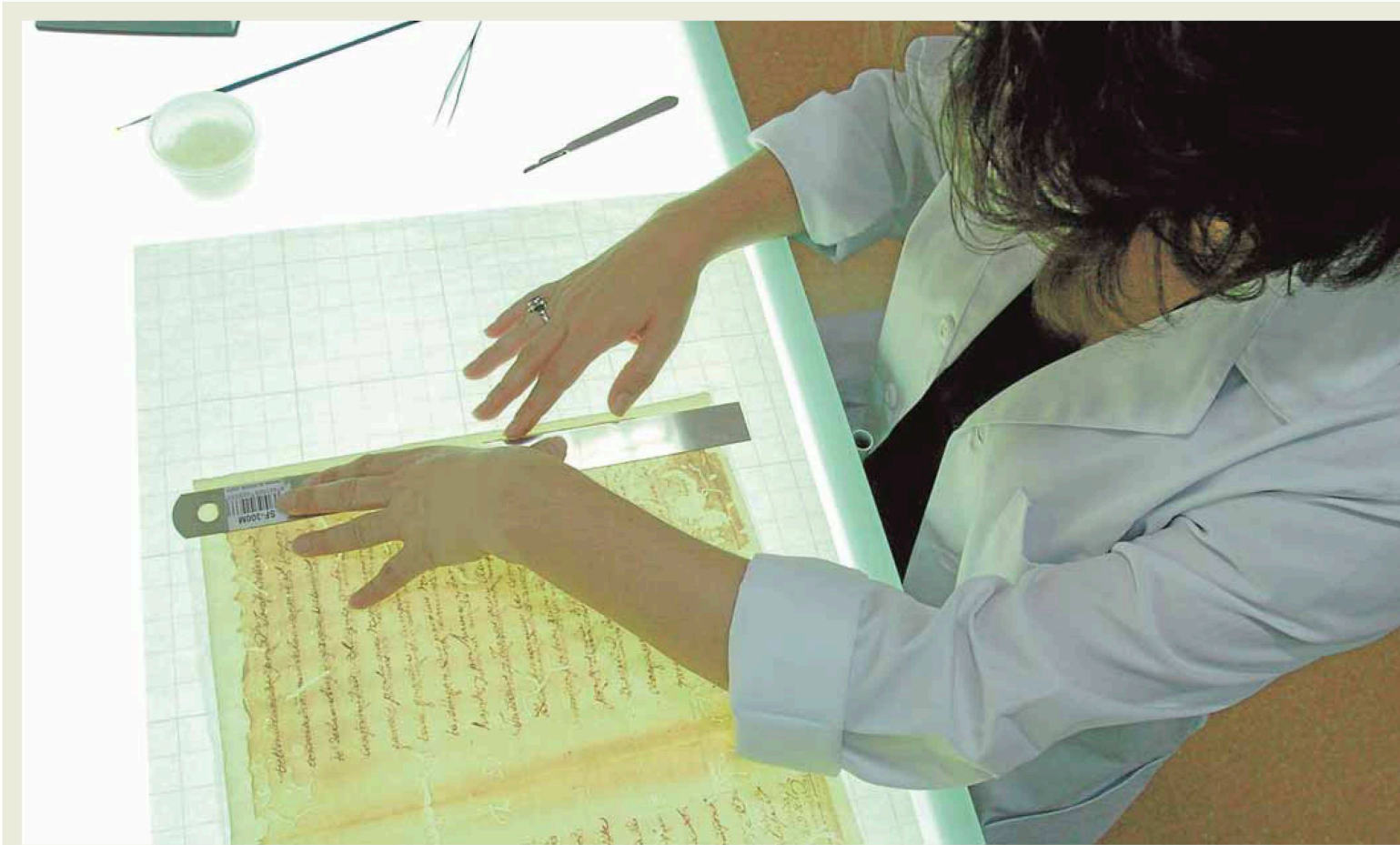
Una técnica del Archivo Regional trabaja en la restauración de un documento sobre una mesa de luz