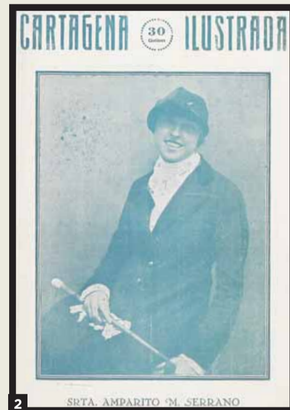
‘Cartagena ilustrada’, de 1926. 3. Plaza de Belluga y catedral de Murcia, hacia 1960.