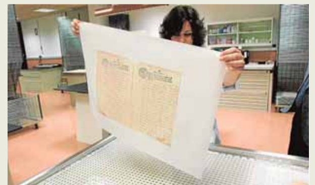
Diferentes fases del minucioso trabajo.

consulta los documentos y nos pide información».