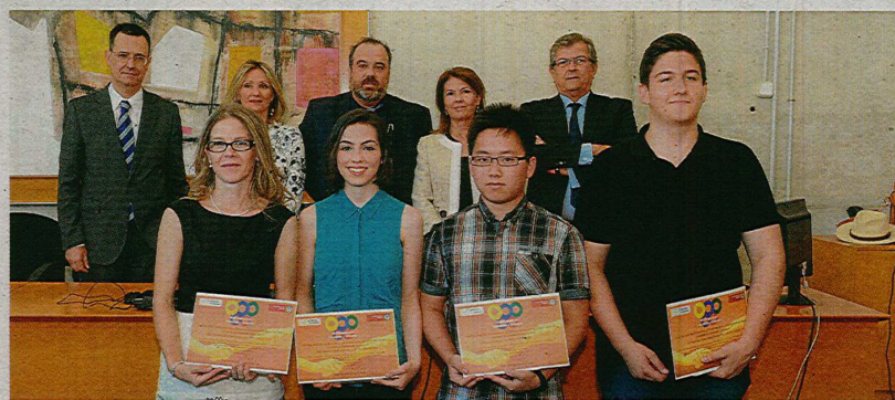
Ganadores de la Olimpiada Regional de Economía y Empresa.

Donación Fundación Centauro Por otro lado, la Delegación de Alumnos de la Facultad de Economía y