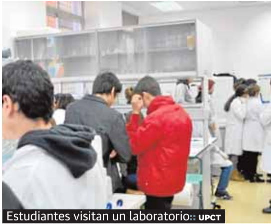
Estudiantes visitan un laboratorio: UPCT

Doscientos ochenta alumnos de segundo de Bachillerato de la modalidad de Ciencias y Tecnología y 26 profesores de 13 centros educativos se han dado cita esta semana en la Escuela Técnica Superior de Ingeniería Agronómica (ETSIA) de la UPCT con motivo de la segunda edi-