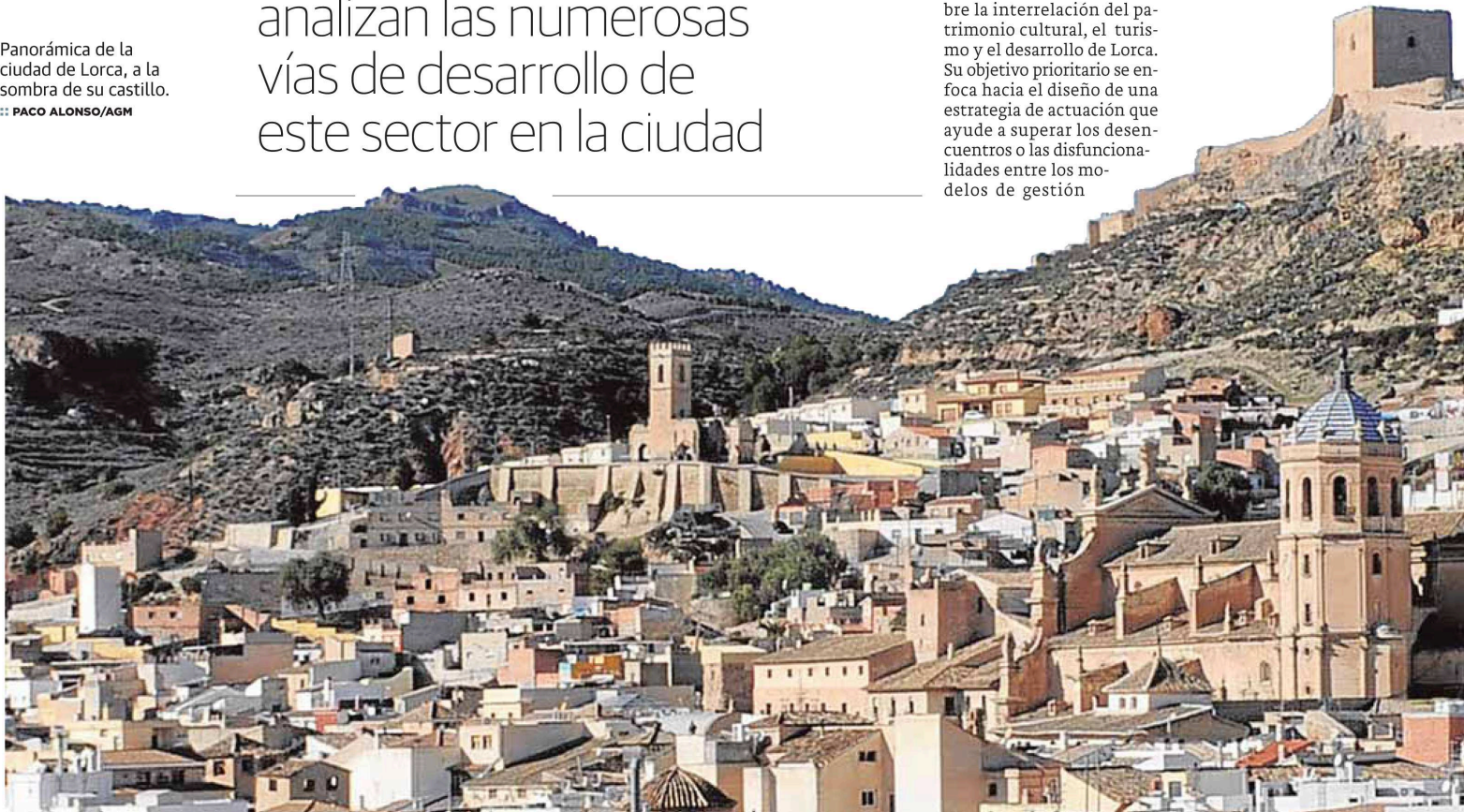
Panorámica de la ciudad de Lorca, a la sombra de su castillo.

Y no es casualidad que su currículum fuese seleccionado por la Agencia Regional de