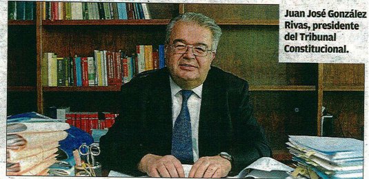
Juan José González Rivas, presidente del Tribunal Constitucional.

► A las 10.30 de la mañana, en el Monasterio de Los Jerónimos, comienzan los actos con la celebración de la Eucaristía, que estará presidida por el cardenal Antonio Cañizares, arzobispo de Valencia