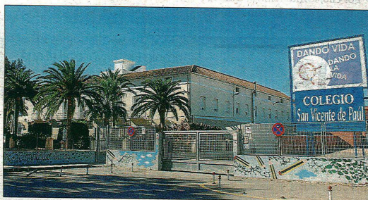
Fachada del Colegio San Vicente de Paúl de Cartagena.

De esta forma se va a impulsar y fortalecer el colegio, haciendo siempre presente el espíritu vicenciano, de San Vicente de Paúl, Santa Luisa de Marillac y Santa Catalina Labouré y el amor a la Virgen María, en lo