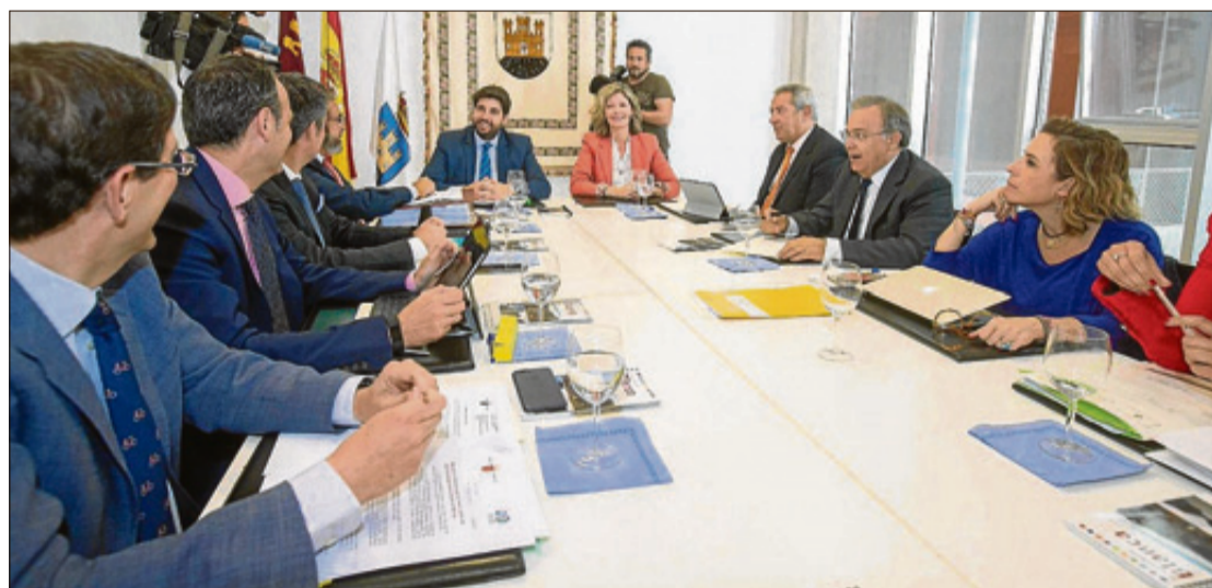
El Consejo de Gobierno se reunió ayer en Blanca. CARM

En cuanto a los jóvenes interesados en trabajar en el sector de la agricultura, recibirán hasta 70.000 euros en ayudas para la puesta en marcha de empresas