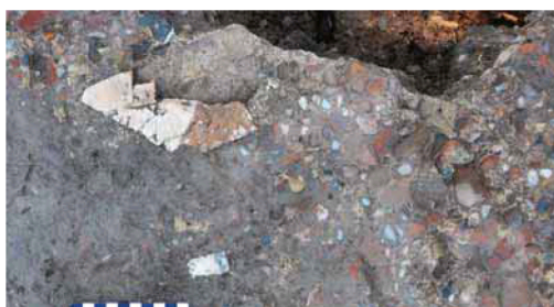
Detalle de la estructura de la construcción.

En los últimos días, en concreto del 4 y al 15 de este mes, se ha procedido a una intervención de campo en el marco del 'I Curso de Arqueología Sierra de Pelayo: excavando el hinterland de Carthago Nova'. La actividad, en la que han participado diversos estudiantes de la UMU, ha permitido sacar a la luz la planta casi completa de una