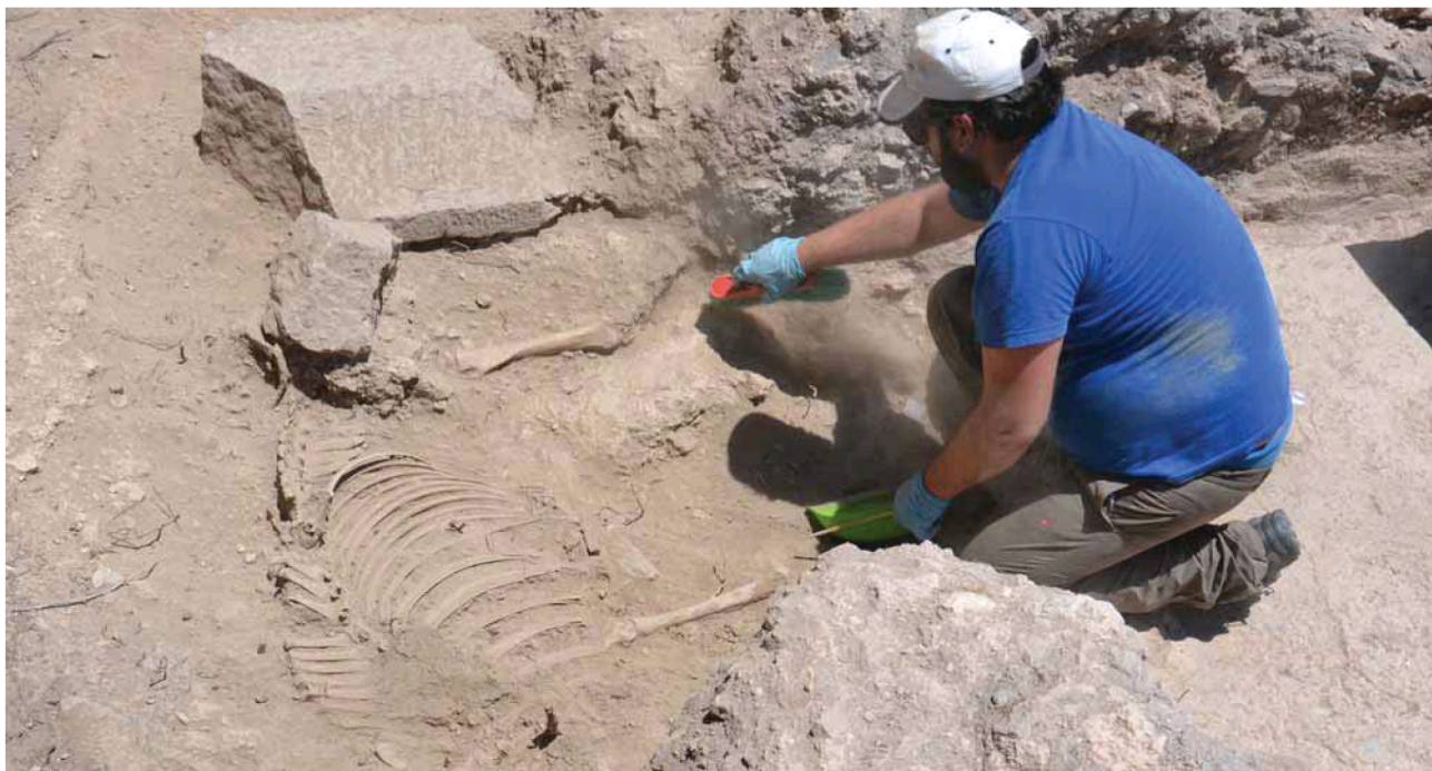
Realización de trabajos arqueológicos en el yacimiento situado en la Sierra de Pelayo.