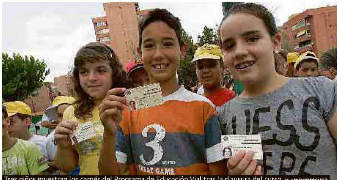
Tres niños muestran los carnés del Programa de Educación Vial tras la clausura del curso.

El Programa Municipal de Educación Vial ha formado este curso a 3.460 alumnos de 75 centros escolares, que ayer recibieron sus carnés en un acto de clausura celebrado en el Parque de Educación Vial de la calle Ángel Bruna. Esos documentos acreditan que los estudiantes han aprendido las normas básicas de circulación y las principales reglas del tráfico, por lo que podrán hacer uso de las bicis y patines del Parque durante todo el verano en horario de mañana.