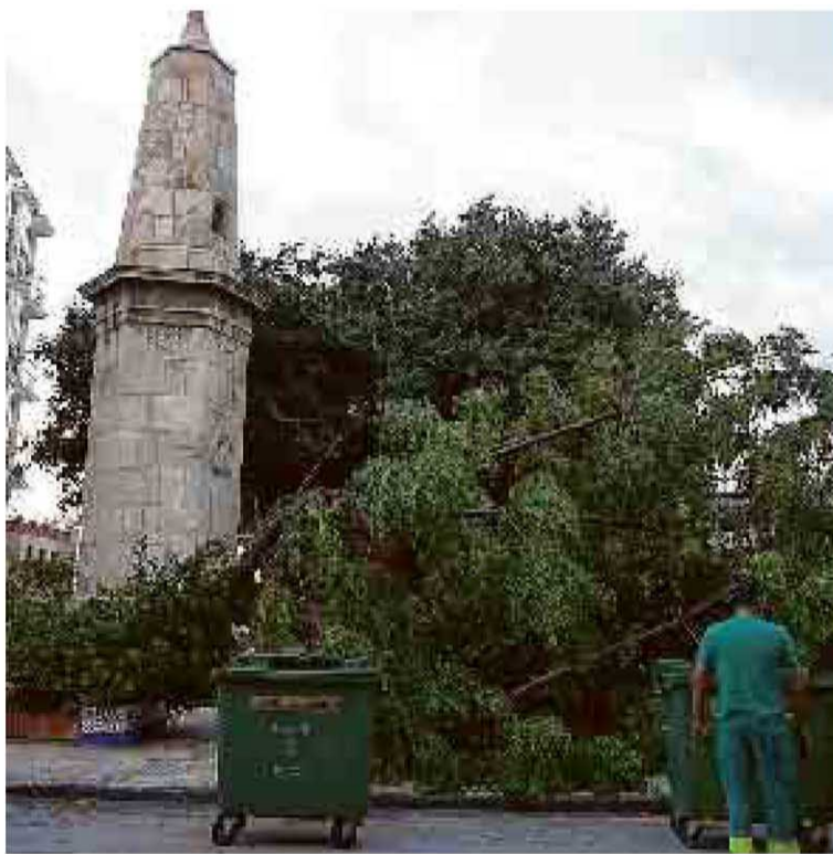
Un jardinero ante un árbol caído en el Pinacho.

Las fuertes rachas de viento tumbaron una melia y un chopo en el Paseo de Delicias, y dañaron las ramas de otras ocho melias, informó ayer un portavoz municipal. El