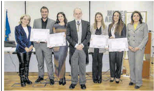
Los cuatro premiados de la UCAM con el presidente de la Academia (c.), la vicerrectora de Investigación (l.) y la decana de Enfermería (d.). UCAM

so de las mismas a través de su Vicerrectorado de Investigación y sus programas de estudio en áreas como la informática, la ingeniería en telecomunicación y las humanidades. En los últimos dos años, casi 3 mil de sus alumnos ya han tenido experiencias educativas inmersivas y se han generado más de 228 horas de docencia en el metaverso.