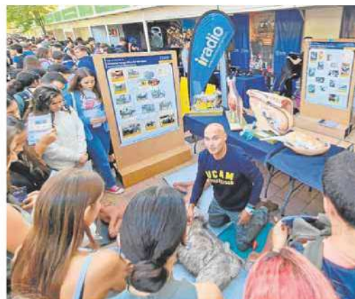
Casi doscientos investigadores de la Universidad Católica participan en los 11 estands situados en el Jardín Botánico del Malecón, en la capital murciana.