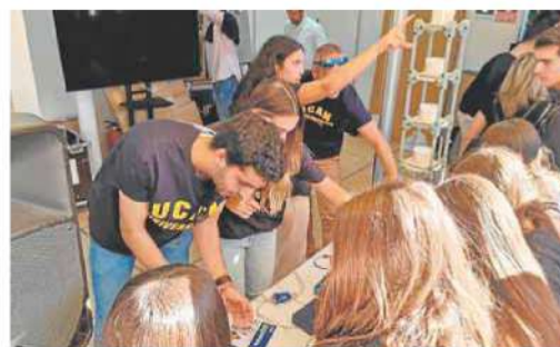
Miles de estudiantes de la Región están pasando por los estands. UCAM

con tres actividades destinadas al cuidado de los animales domésticos: la visualización de muestras anatómicas, actuaciones de emergencia en perros con politraumatismos y talleres para aprender primeros auxilios para pequeños animales. También está presente UCAM HiTech, la incubadora de alta