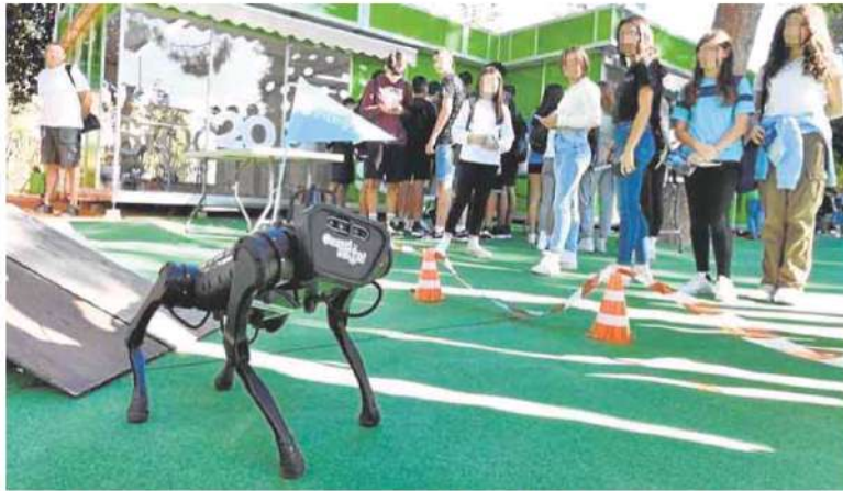
Estudiantes observan uno de los robots utilizados por los Tedax, ayer.

Miles de estudiantes se dan cita en la Semana de la Ciencia y la Tecnología para conocer el lado más divertido de la experimentación